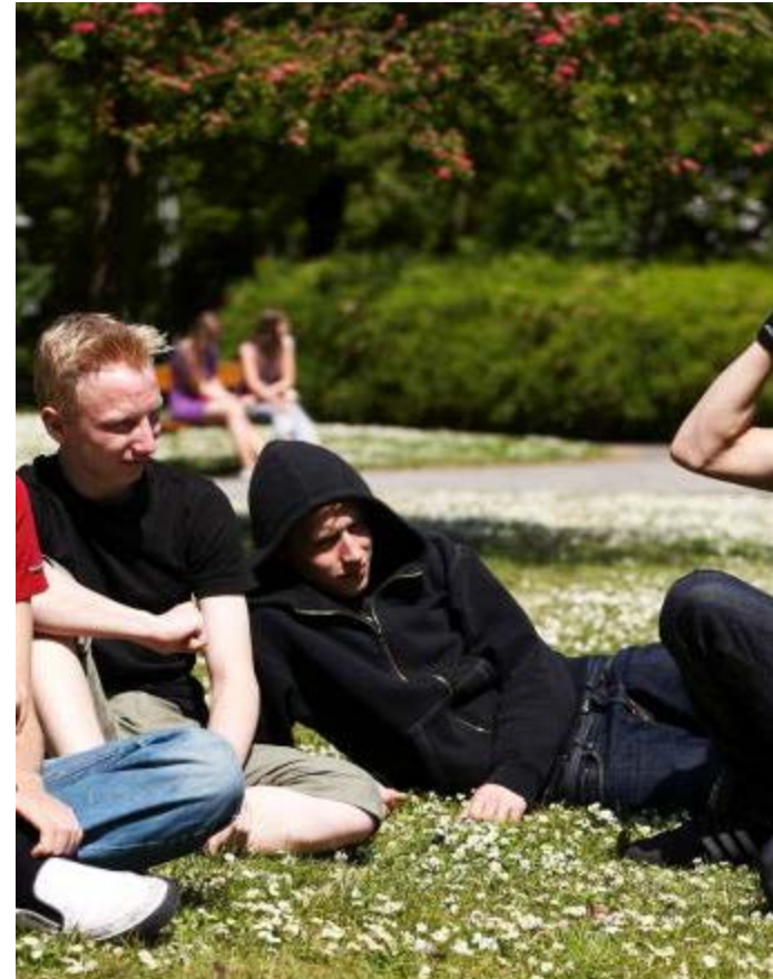
Foto: Freddy Billqvist Gymnasie- og vuxenutbildningsförvaltningen, Malmö stad