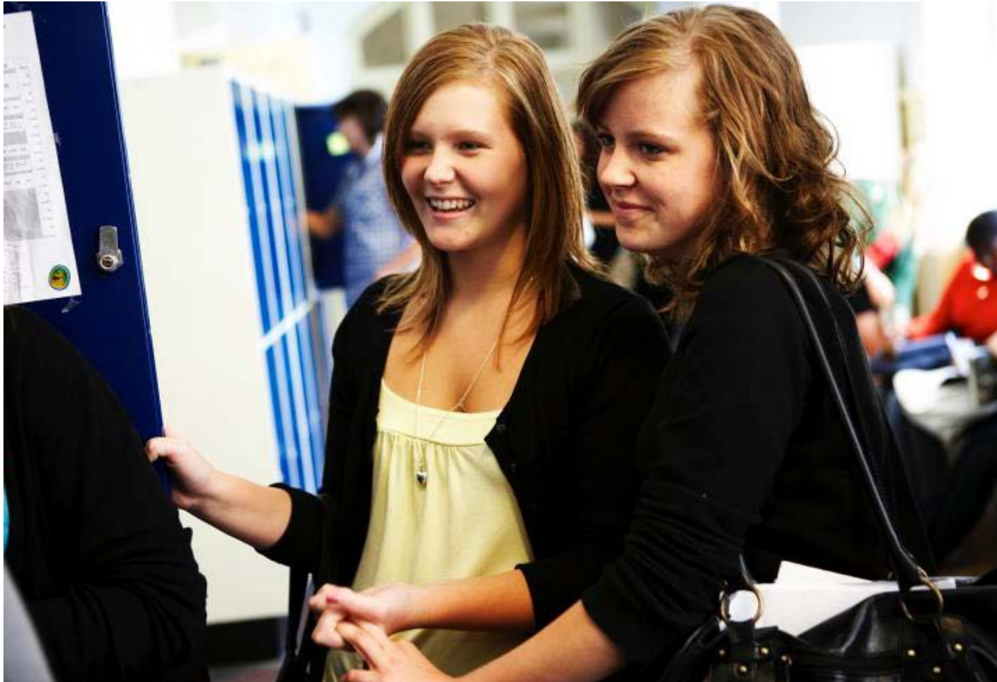
Slutevaluering - Preveting Dropout