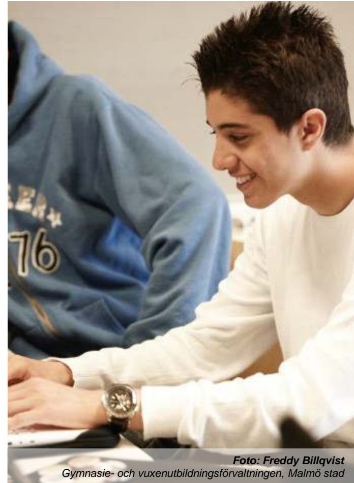
Foto: Freddy Billqvist Gymnasie- och vuxenutbildningsförvaltningen, Malmö stad